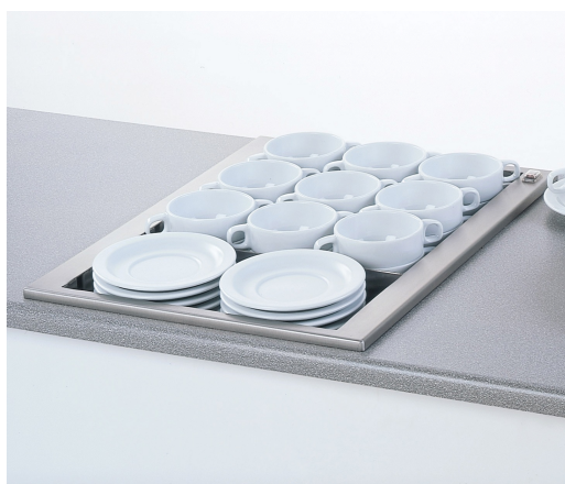
2 THSG - 02.1512

Verwarming middels een siliconemat. Incl. beveiliging tegen oververhitting.